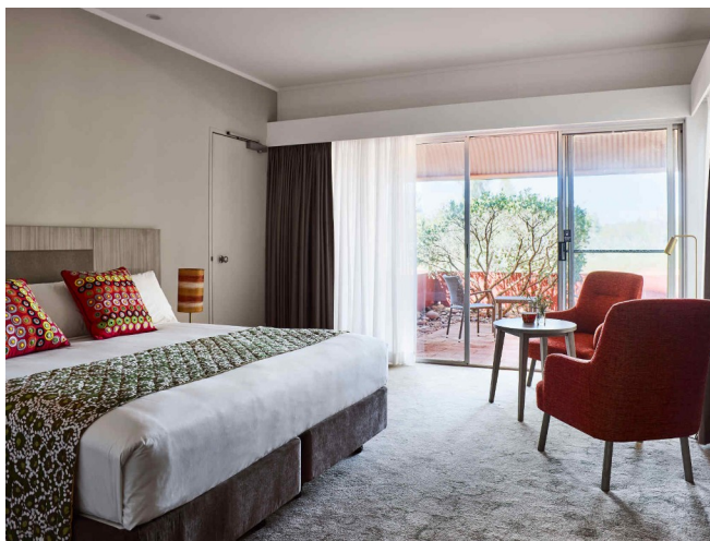
Voyages Desert Gardens **** Standard room

VIATGES MANACOR El valor de l'experiència