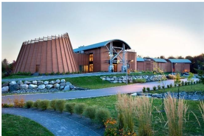
WENDAKE: Hotel Musee Premieres nations 4* Standard room

VIATGES MANACOR El valor de l'experiència