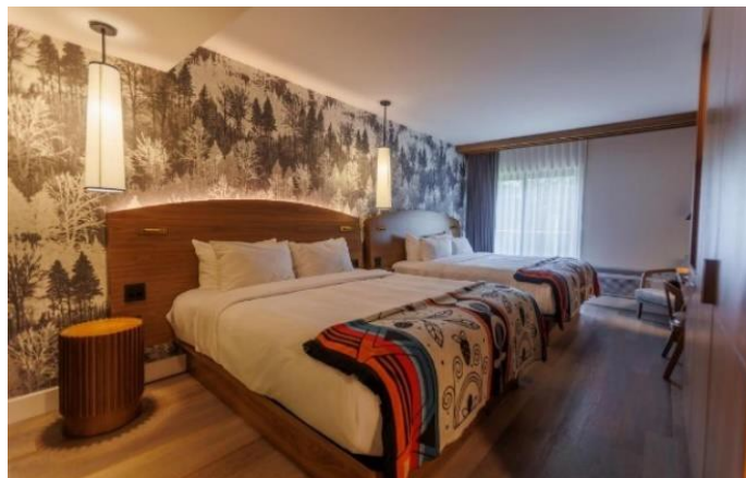
SAGUENAY: OTL Gouverneur Saguenay 5* Superior room